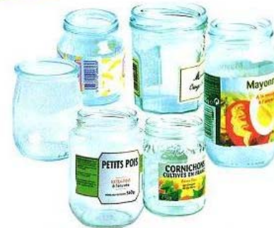
Bocaux et petits pots...