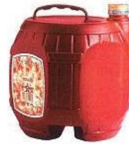
cutibainiers de vin ...