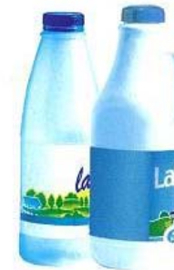
Bouteilles de lait, de soupe ...