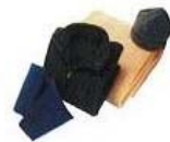
Vêtements en fibre polaire

2600 bouteilles en plastique triées = 1 950 pulls en fourrure polaire recyclée = 8 m 3 d'eau économisés