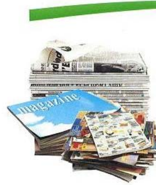
journaux, magazines, prospectus ...