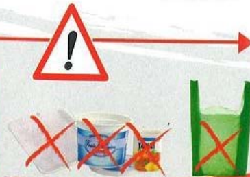
Petits emballages en plastique ou en polystyrène