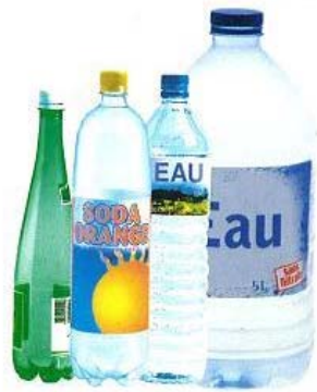
Bouteilles d'eau, de jus de fruit, de soda ...

Je les jette en vrac dans le bac à couvercle jaune avec leurs bouchons