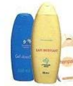
Flacons de produits d'hygiène et de beauté ...