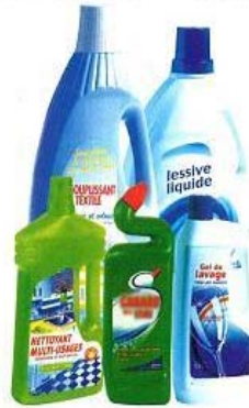
Bouteilles d'adoucissant, de lessive, de liquide lave-vaisselle, de javel ...