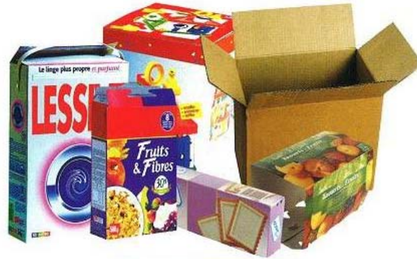
cartons, cartonnettes ...

Je les jette en vrac dans le bac à couvercle jaune