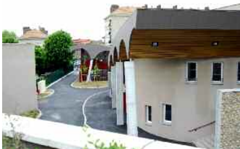
La nouvelle école Jean Jaurès.

Il est en effet primordial que les jeunes ermontois puissent être accueillis dans des locaux de qualité. C'est dans cet objectif que le nouveau groupe scolaire Jean Jaurès a été construit.