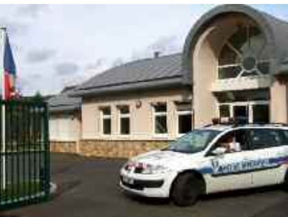
CSU de Saint-Prix.