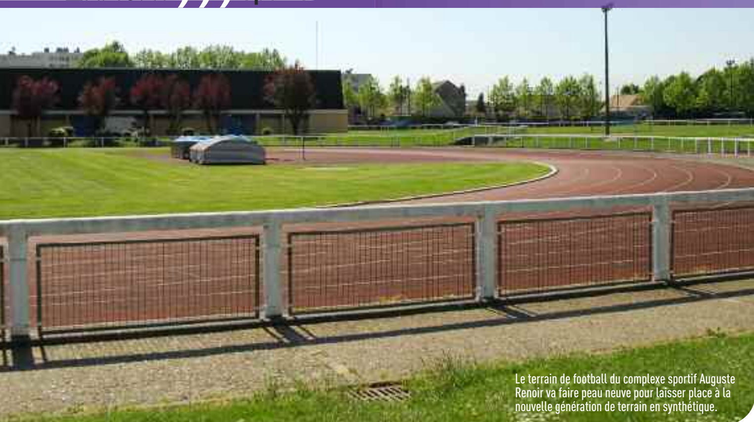
Le terrain de football du complexe sportif Auguste Renoir va faire peau neuve pour laisser place à la nouvelle génération de terrain en synthétique.