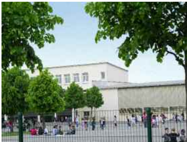
École Victor Hugo.

La Direction de l'Action Éducative avec les Services Techniques municipaux gèrent également l'ensemble des travaux à effectuer chaque année dans les écoles. L'entretien des bâtiments des écoles représente aujourd'hui un budget très important, à savoir 1 874 500 €, soit 38,26 % du budget d'investissement de la commune sur un total de 4 898 865 €.