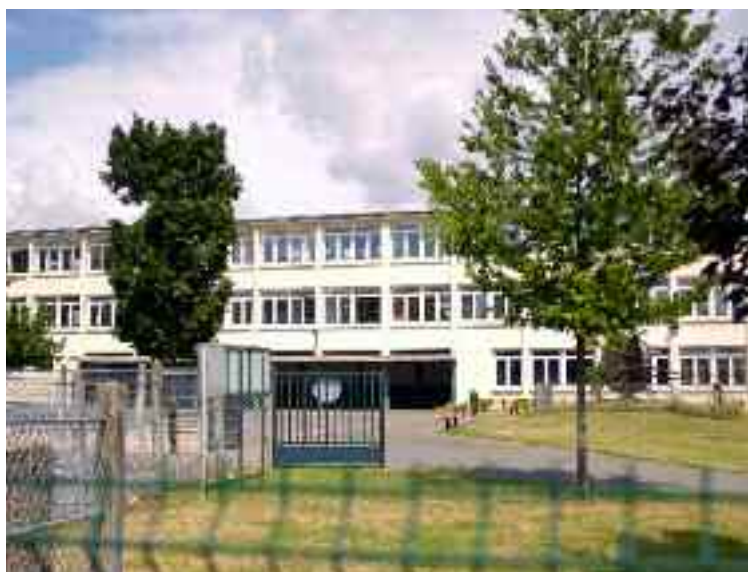
École Eugène Delacroix.

Afin de respecter la loi en vigueur, chaque année, la Municipalité procèdera à la mise aux normes de ses différents établissements notamment scolaires. Un budget pluriannuel est donc consacré à ces travaux importants.