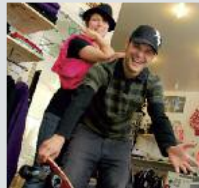
Thinkshop : la nouvelle boutique des sports de glisse du département.