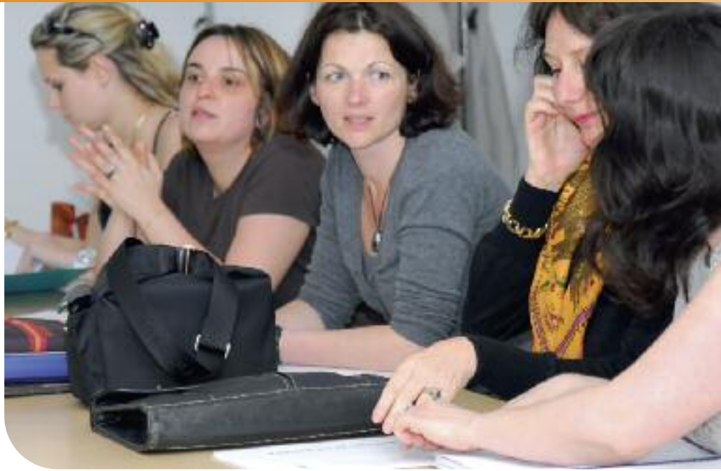
La commission des menus veille à l'équilibre alimentaire de nos enfants et élabore ainsi chaque trimestre les menus de la restauration scolaire avec les conseils d'une diététicienne.

LA MUNICIPALITÉ PORTE UNE ATTENTION TOUTE PARTICULIÈRE À L'ÉQUILIBRE NUTRITIONNEL DE SES ÉCOLIERS. AUSSI, POUR LE BIEN-ÊTRE DE NOS ENFANTS, UNE COMMISSION DES MENUS SE RÉUNIT TOUTS LES TROIS MOIS POUR VALIDER LES MENUS DES HUIT SITES DE RESTAURATION IMPLANTÉS AU SEIN DES GROUPES SCOLAIRES DE NOTRE COMMUNE. NOUS AVONS ASSISTÉ À L'UNE D'ENTRE ELLES.