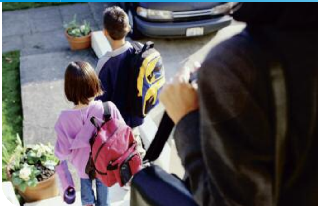
Les élèves ermontois vont à l'école en toute sécurité.

DANS LE CADRE DE LA MISE EN PLACE DE LA NOUVELLE SECTORISATION SCOLAIRE, CERTAINS ENFANTS ERMONTOIS SERONT AMENÉS À UTILISER DE NOUVEAUX PARCOURS POUR REJOINDRE LEUR ÉCOLE. CES PARCOURS ONT ÉTÉ SÉCURISÉS CET ÉTÉ.