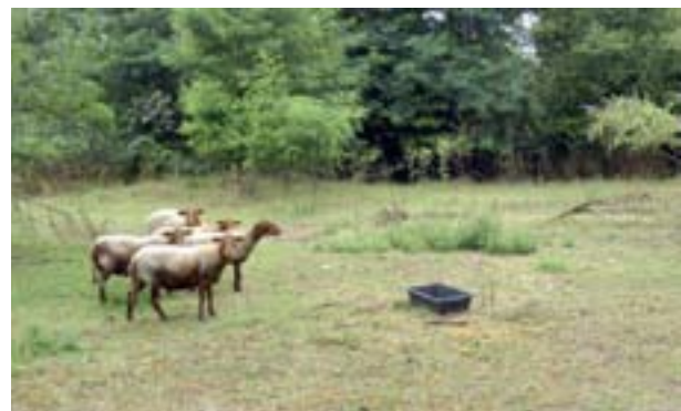
Voici le résultat du travail de nos moutons.