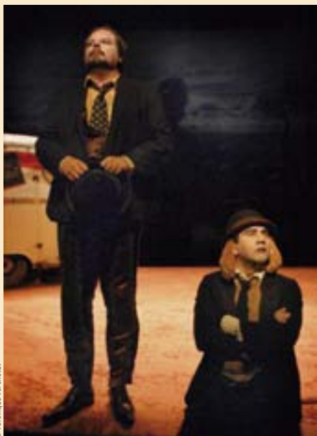
Dialogue d'un chien avec son maître sur la nécessité de mordre ses amis.

Pour la première fois cette saison, Ermont-sur-Scènes organise une opération en partenariat avec l'Orange bleue de la ville d'Eaubonne. Le thème de cette manifestation : les belges ! Six spectacles sont programmés dans ce cadre. À Ermont, Dialogue d'un chien avec son maître sur la nécessité de mordre ses amis par le Théâtre national de la communauté française de Belgique, le 16 octobre, La tragédie comique par La Fabrique imaginaire, le 21 octobre, et Chagrin d'amour par le théâtre de Galafronie, à voir en famille dès 7 ans.