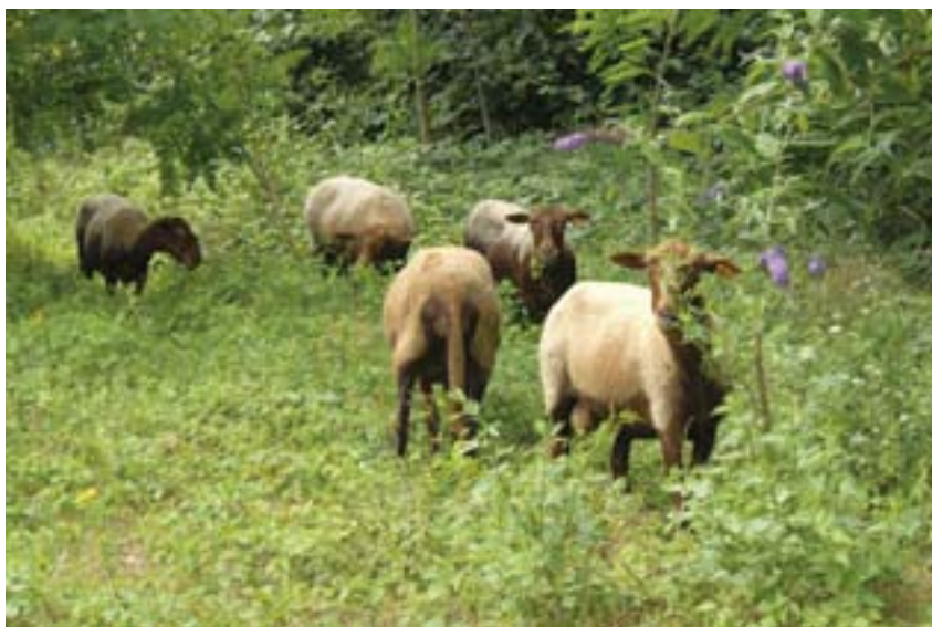
Cinq moutons « solognote » pâturent les zones en friche de la ville depuis le mois de juillet dernier.

BIEN DÉCIDÉE À PRÉSERVER LA BIODIVERSITÉ EN VILLE, LA MUNICIPALITÉ A MIS EN PLACE UNE NOUVELLE ACTION DESTINÉE À PERMETTRE UN ÉCOPÂTURAGE EN PLEIN CŒUR DE LA VILLE. DEPUIS JUILLET DERNIER, CINQ MOUTONS PÂTURENT DES ZONES EN FRICHE.