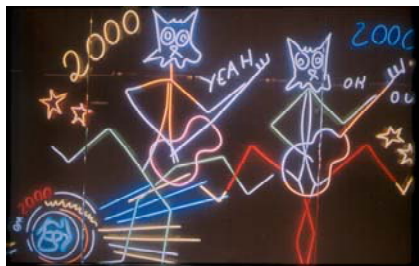
Tableau de lumières d'Alain Séchas