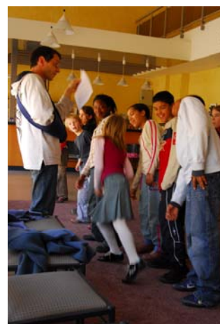
Les RTCJ l'an passé

De plus, avec Ermont-sur-Scènes, nous animons les R.T.C.J. (Rencontres de Théâtre Contemporain pour la Jeunesse). Initiée depuis 2003 par l'ADIAM 95, cette opération aborde la lecture de pièces, la pratique du théâtre et la restitution sous forme de spectacle du travail mené dans les classes. Cette année, nous allons faire travailler des classes de CM2 de l'école Victor Hugo sur l'adaptation théâtrale du roman Sa Majesté des Mouches de William Golding. Enfin, la commune d'Ermont, à travers la Direction de l'Action Culturelle, fait régulièrement appel à nous pour des lectures en marge d'une action culturelle ou d'un spectacle."